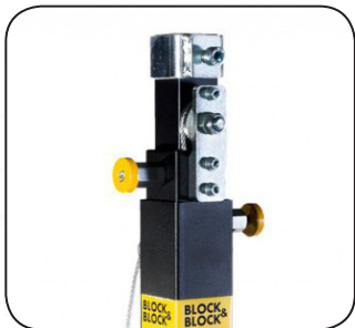
Oversized steel cables and pulleys; Steel safety pins / Cavi e pulegge in acciaio sovradimensionati; Spine di sicurezza in acciaio