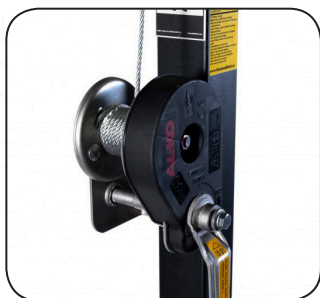
Self-braking safety winch/ Argano autofrenante di sicurezza